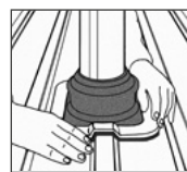
4. DEKTITE® formgenau an Profilblech anpassen.