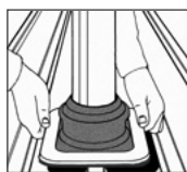
2. DEKTITE® an Profilblech anpassen und markieren.