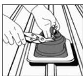
1. DEKTITE® an Rohr anpassen.

Bei Faserzementplatten Presslaschenblindniete verwenden. Profilhöhe max. 45 mm.